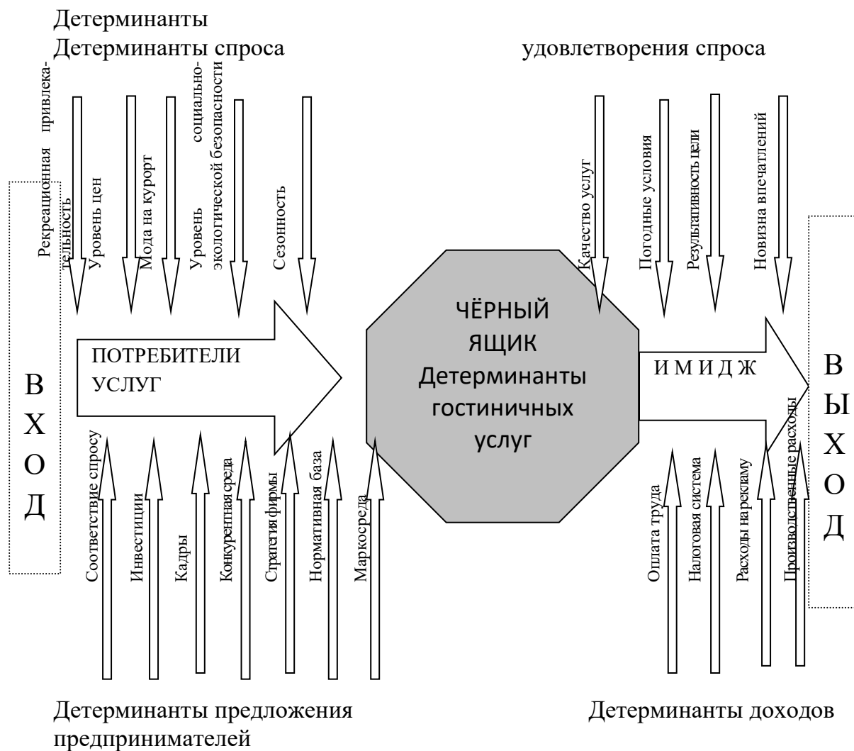
Рис. 1. Система детерминантов рынка гостиничных услуг в укрупнённой агрегации

Количество видов предоставляемых услуг возросло с ростом спроса постояльцев. Этот же спрос определял и разнообразие видов средств размещения: таверны, постоянные дворы, заезды, приюты, почтовые станции, караван-сарай, госпиции – старинноприимные дома, гостиницы: для патрициев – мансионес и для плебеев – стабулярии, отели – первоначально дворцы для знатных гостей.