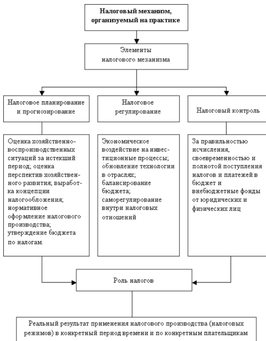
Рис. 1. Структура налогового механизма [5, с. 25]

Ключевая задача налогового контроля – это создание условий, которые препятствуют выполнению налоговых обязательств налогоплательщиком.