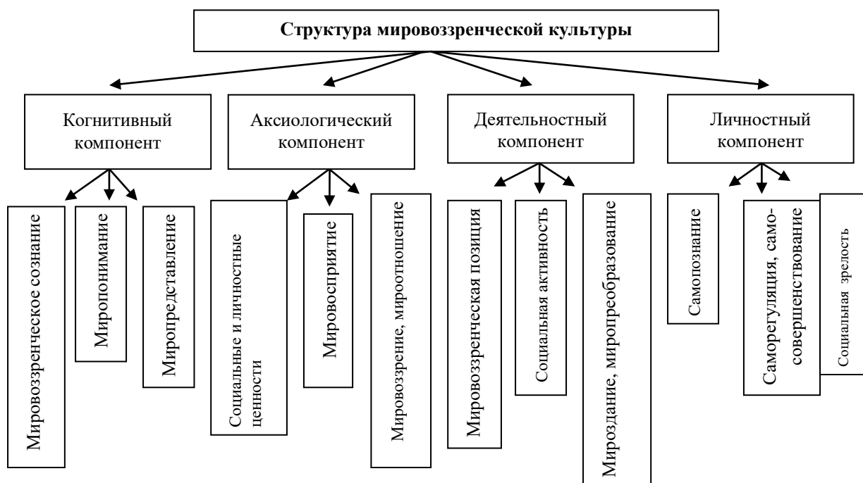
Рис.1. Структура мировоззренческой культуры личности

Анализируя когнитивный компонент мировоззренческой культуры личности, мы замечаем, что в основании мировоззренческого сознания личности лежат мировоззренческие знания, которые и являются первичными в формировании. Это означает, что становление мировоззренческой культуры может происходить через усвоение системы знаний и утверждения нового мышления, которое характеризуется реалистичностью, открытостью, критичностью и самокритичностью, ориентацией на самовыражение, дискуссионность, демократизм. Этот процесс требует новых подходов к человеку.